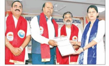
शिथी हासिल कर रही हुई छात्रा।