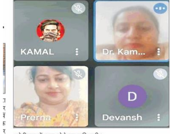
सेमिनार में भाग लेते हुए प्रतिभागी।